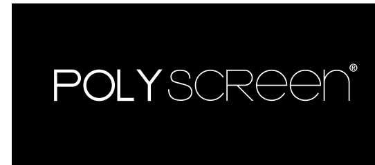
BLANCO Y NEGRO, NEGATIVO