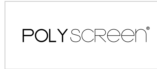
BLANCO Y NEGRO, POSITIVO